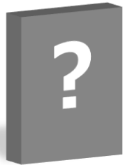
他社ウイルス対策製品